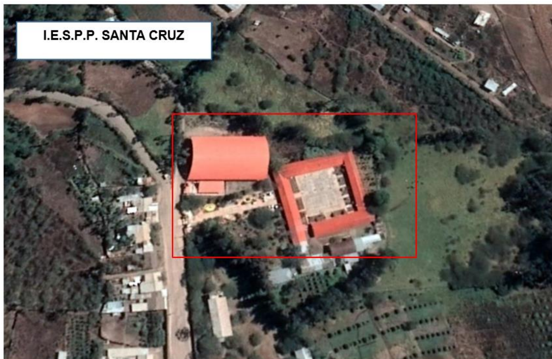
Imagen 1: Vista Satelital de I.E.S.P.P. Santa Cruz, Coordenadas N:9268327, E:726753 y C:2000 m.s.n.m