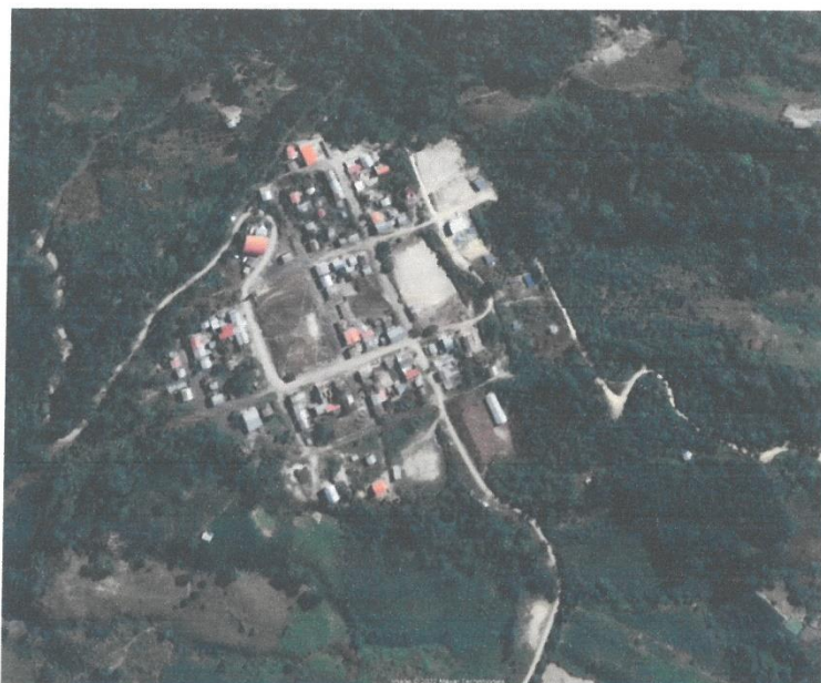
IMAGEN SATELITAL DE LA UBICACIÓN DE LA IEI NUEVA FORTALEZA