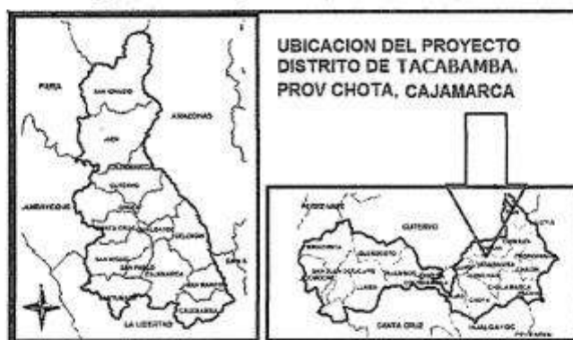
Imagen N° 01. Mapa del distrito de Tacabamba

Nivel de los estudios de preinversión, según corresponda Fecha de declaración de viabilidad, de ser el caso