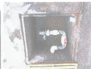
Imagen 06: limpieza y desinfección de cámara de compensación.