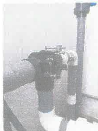
Imagen 09: reparación de instalaciones para piscina de niños.