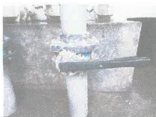
Imagen 05: suministro de llaves manposa de 3" y 4" de hierro.