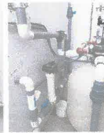
Imagen 11: reparación de electrobombas para piscina de niños.