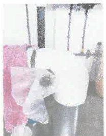
Imagen 08: reparación de instalaciones para filtros.