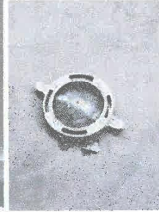
Imagen 04: suministro de tapa para electrobomba.