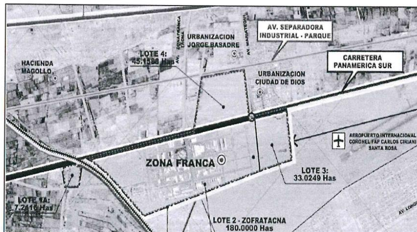
Ilustración 2: Micro localización; Fuente: estudio de pre inversión.