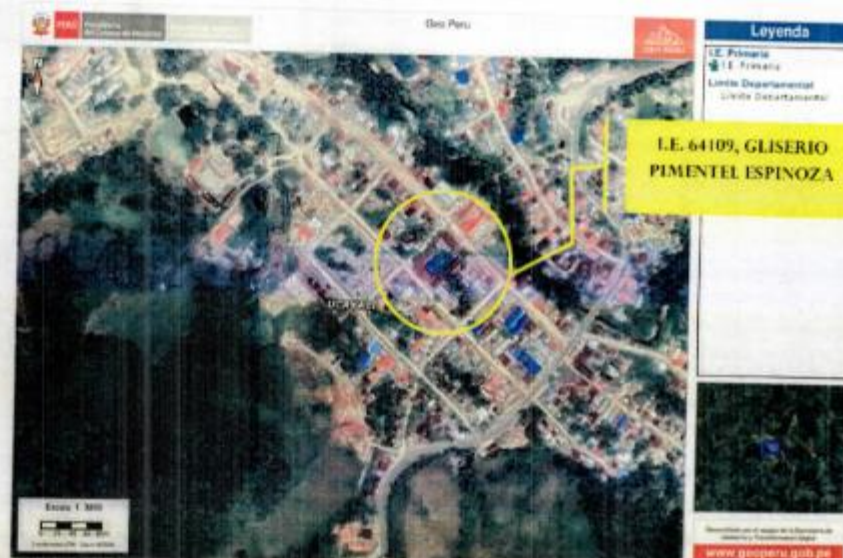
Ilustración 1. Vista Satelital de la Ubicación de la IE en el Distrito de Huipoca