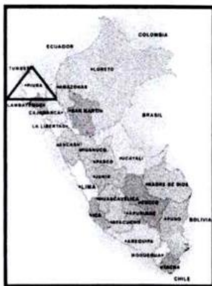
Figura 02: Mapa político del Perú.