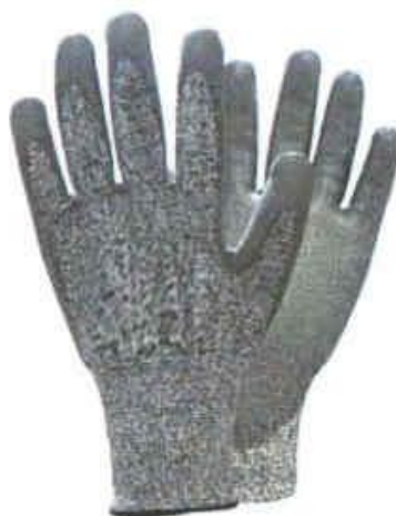
GUANTES DE TRABAJO