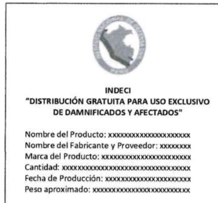
Imagen referencial embalaje secundario