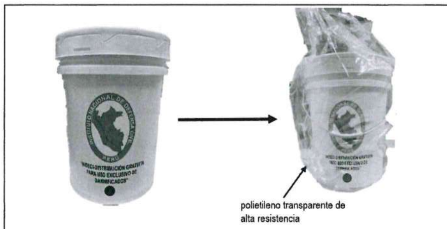
Imagen referencial embalaje primario del balde industrial de 20L con tapa