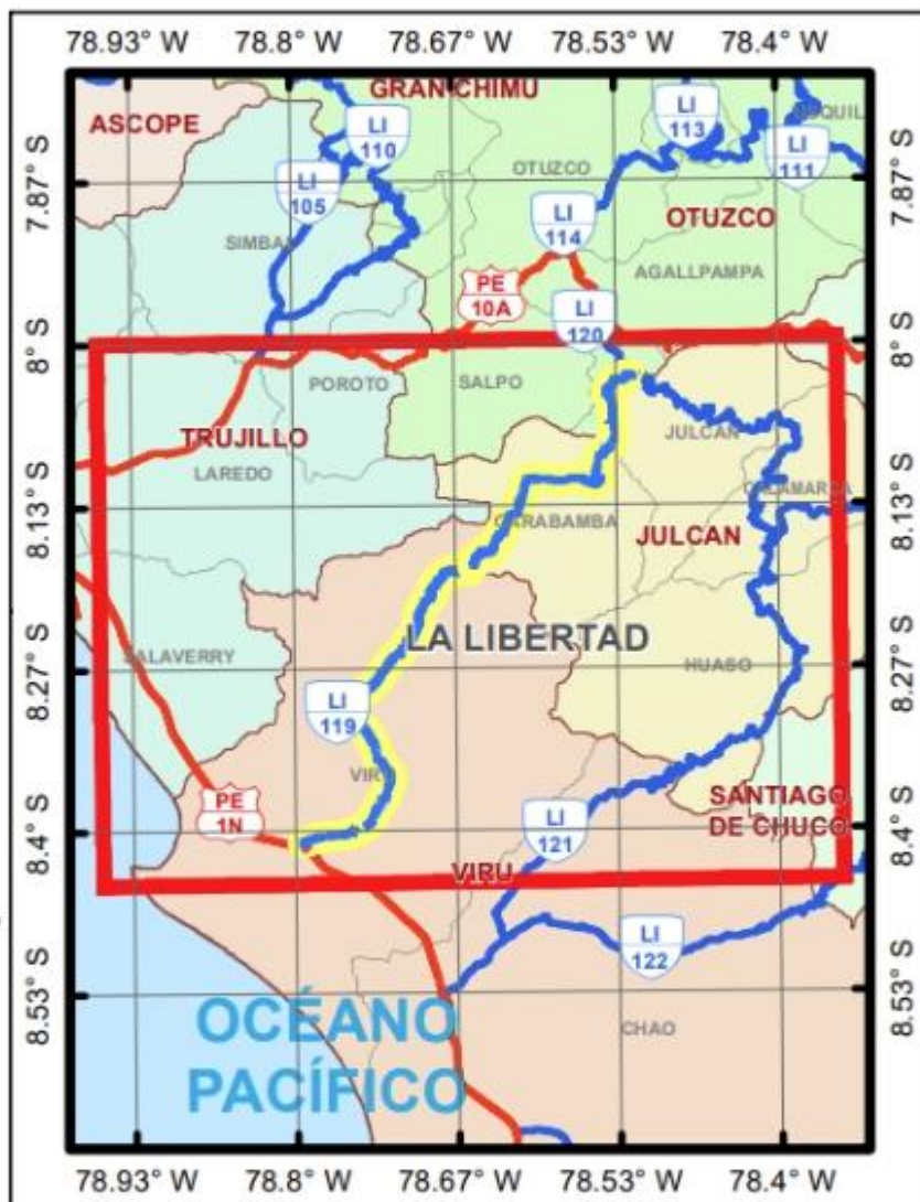
MAPA DE UBICACIÓN DE LA CARRETERA DEPARTAMENTAL LI-119

"Año del Bicentenario, de la consolidación de nuestra independencia, y de la conmemoración de las heroicas batallas de Junín y Ayacucho"