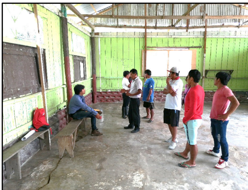
Trabajos de Coordinación con pobladores del Comunidad San Pedro

Para evitar el deterioro de las veredas nuevas, se colocó tuberías de pase de PVC unión flexible para las aguas de las lluvias que discurren de manera natural por toda la vía.