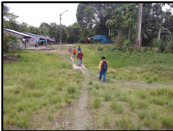
Vista de la Ruta del Acceso en tiempo de lluvias

Existen zonas en donde los pobladores tiene que colocar trozos de madera para poder transitar de manera ciertamente segura entrado o saliendo del caserío.