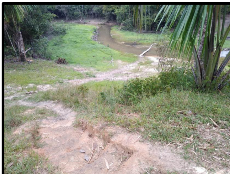
Vista de la Ruta del Acceso en tiempo de lluvias