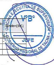
Ilustración 1: Ejemplo del contenido mínimo del personal acreditado de supervisión