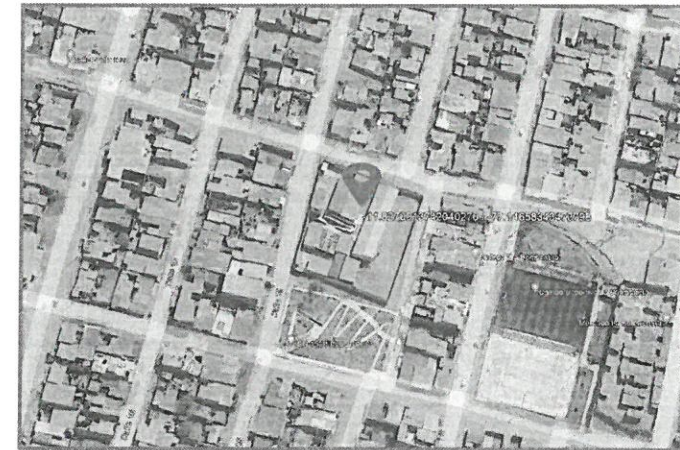
Figura N°1: Ubicación de la I.E. N°152.

El perfil del proyecto indica que se construirán las siguientes áreas: