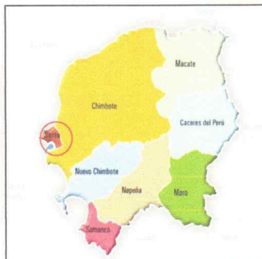
MAPA N°3. Ubicación de la zona del proyecto.