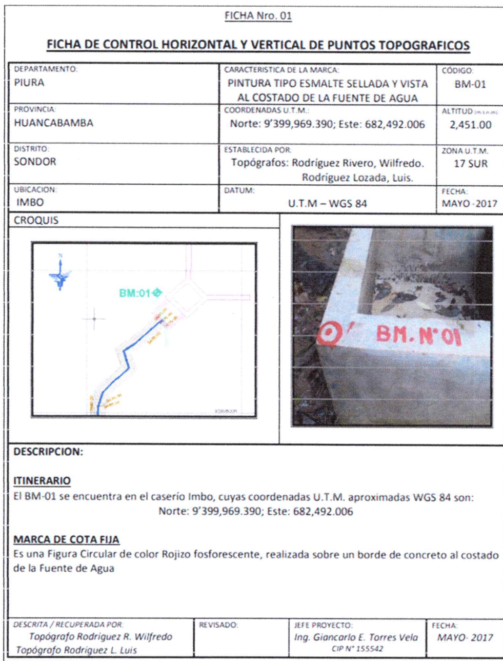
Imagen N° 01: Ejemplo Ficha BM Auxiliar: