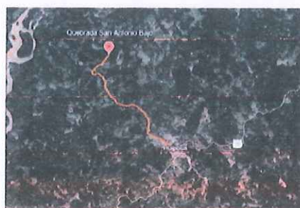
Mapa de ubicación de proyecto