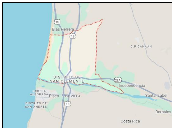
GRAFICO N° 01: UBICACIÓN GEOGRAFICA DE SAN CLEMENTE.

DEPARTAMENTO : Ica PROVINCIA : Pisco DISTRITO : San Clemente