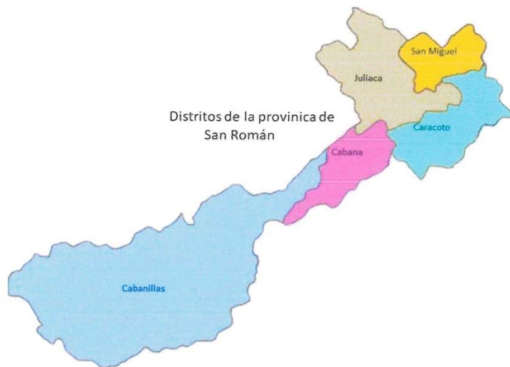
IMAGEN N°04: UBICACIÓN DEL PROYECTO