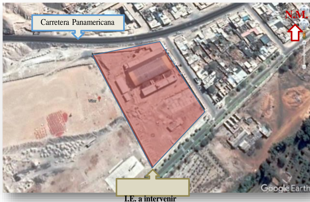
IMAGEN N° 01: ubicación terreno a intervenir, está ubicado en la zona urbana del distrito de Vítor ya consolidada que cuenta con todos los servicios básicos.