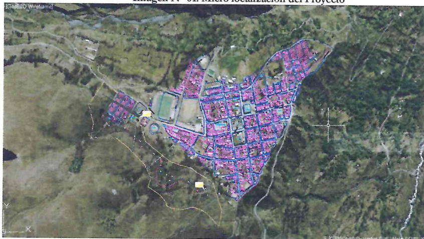
Imagen N° 01: Micro localización del Proyecto

En área de influencia del proyecto abarca toda la localidad de Ayapata, quienes se beneficiarán con el proyecto.