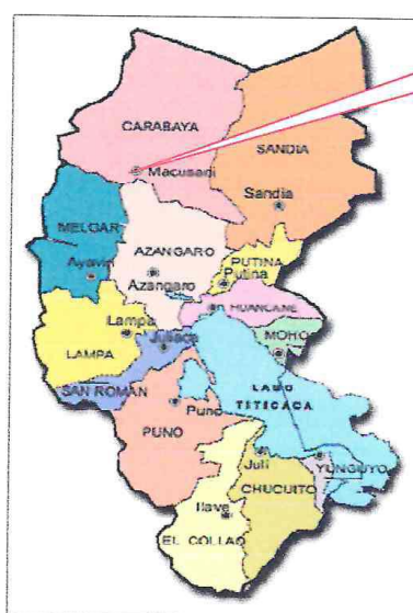
Fig. N°01 Ubicación Nacional de la zona del Estudio