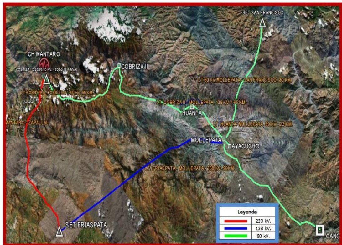
Fig. 1. Localización del área de influencia del Proyecto

La línea roja es la Línea de Subtransmisión 66 KV, donde se instalará la fibra óptica ADSS