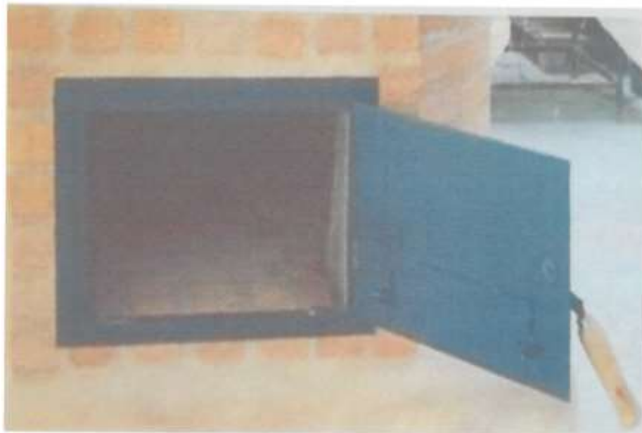
VISTA FRONTAL DE PUERTA METALICA