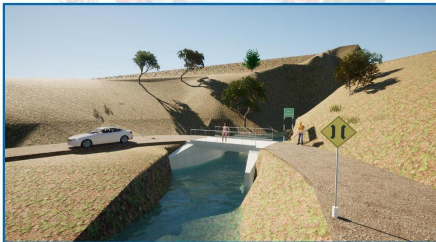
Figura N° 10: Vista 3D del puente.