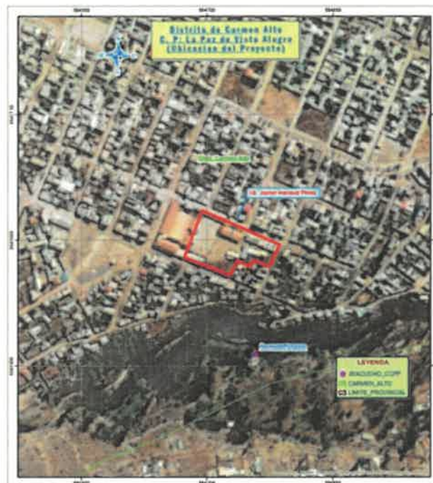
IMAGEN 03 DE LA POLIGONAL DE LEVANTAMIENTO TOPOGRÁFICO (VER PLANOS PARA SU MAYOR ILUSTRACIÓN)