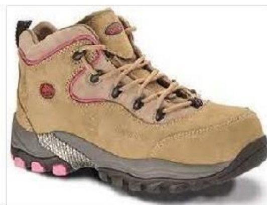
Imagen referencial para damas

Fotografía Referencial del Botín Dieléctrico para varón y dama