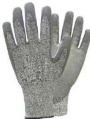
GUANTES DE TRABAJO