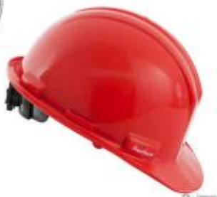
CASO DE SEGURIDAD