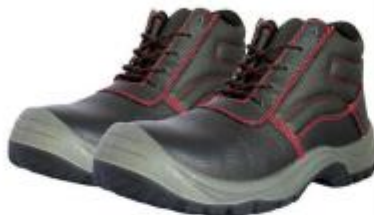
ZAPATOS DE SEGURIDAD TRABAJO – SEGURIDAD