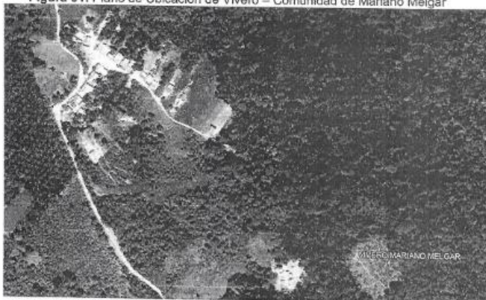
Figura 01: Plano de Ubicación de Vivero – Comunidad de Mariano Melgar