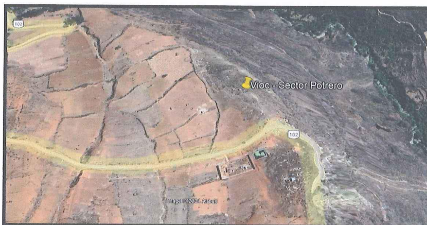
Lugar del proyecto.

El acceso a la localidad de Huacachi desde la ciudad de Huaraz, se encuentra descrita según el cuadro que a continuación se detalla: