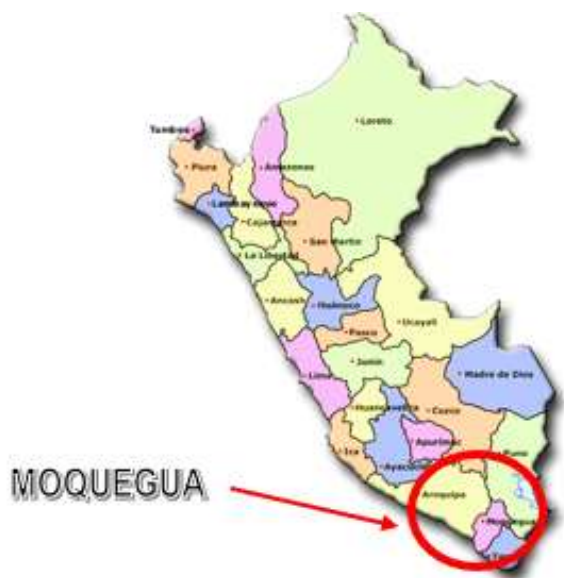
IMAGEN N° 1 UBICACIÓN DEPARTAMENTAL DEL PROYECTO EN EL PERÚ

Geográficamente el proyecto se encuentra emplazado en las siguientes coordenadas UTM aproximadas: UTM 301258 m E y 8111570 m S, el consultor deberá coordinar con el responsable de proyecto sobre la ubicación exacta.