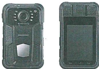
Imagen Referencial: Cámara Corporal