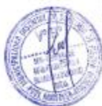
LOCALIDAD DE SAN PEDRO DE CACHI