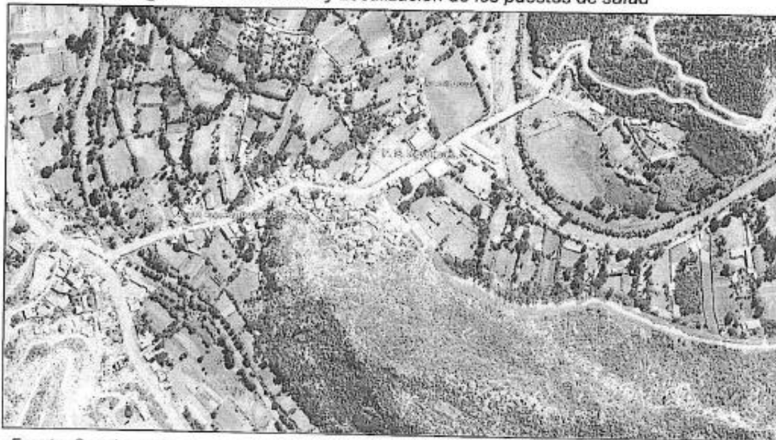
Imagen N°02 Ubicación y Localización de los puestos de salud

"Año del Bicentenario, de la consolidación de nuestra Independencia, y de la conmemoración de las heroicas batallas de Junín y Ayacucho"