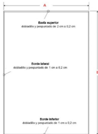
Imagen homogeneización de la ACFFAA: