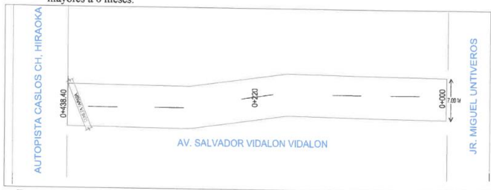
Esquema de la Av. Salvador Vidalón, donde se ejecutará el servicio

El proveedor del servicio deberá contar con un laboratorio básico de concreto asfáltico en su planta el cual deberá incluir; equipo de lavado asfáltico, equipo compactador Marshall, Prensa Marshall, Tamices para la granulometría y equipo para densidad de probetas, entre otros necesarios, además de un equipo para medir la compactación in situ del concreto asfáltico durante la colocación de este y la medición de temperatura debidamente calibrados con certificados de calibración vigente no mayores a 6 meses.