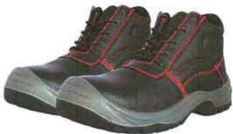
ZAPATOS DE SEGURIDAD TRABAJO – SEGURIDAD

INSTITUTO DE VIALIDAD MUNICIPAL DE LA PROVINCIA DE CAJABAMBA AÑO 2024