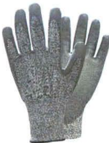
GUANTES DE TRABAJO