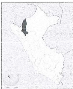
de Amazonas en el mapa del Perú