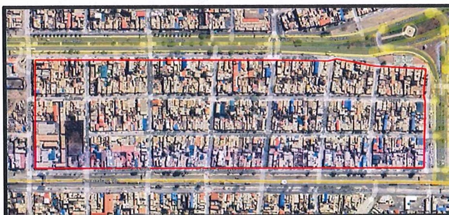
Micro localización (Distrito de nuevo Chimbote P.J. Primero de Mayo)