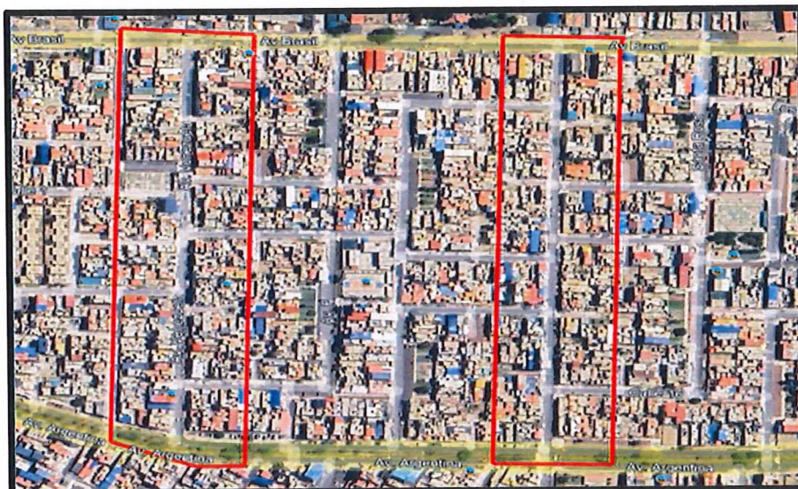
Micro localización (Distrito de Nuevo Chimbote Av. La Marina – Av. Bolivia )