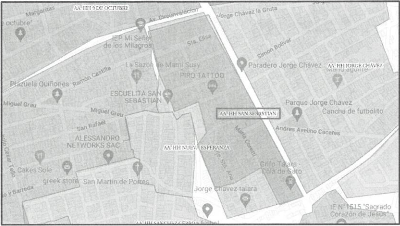
UBICACIÓN DEL PROYECTO

Este proyecto mejorará el servicio de Agua Potable y Alcantarillado de las Familias ubicadas en el AA. HH San Sebastián.