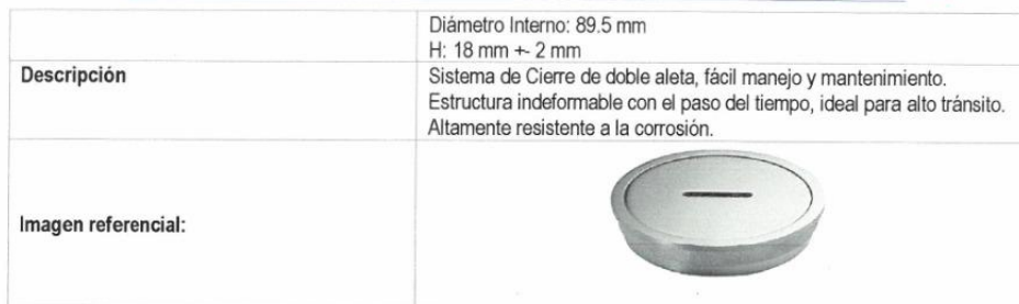
TABLA 25. REGISTRO CON ROSCA DE BRONCE CROMADO 2"