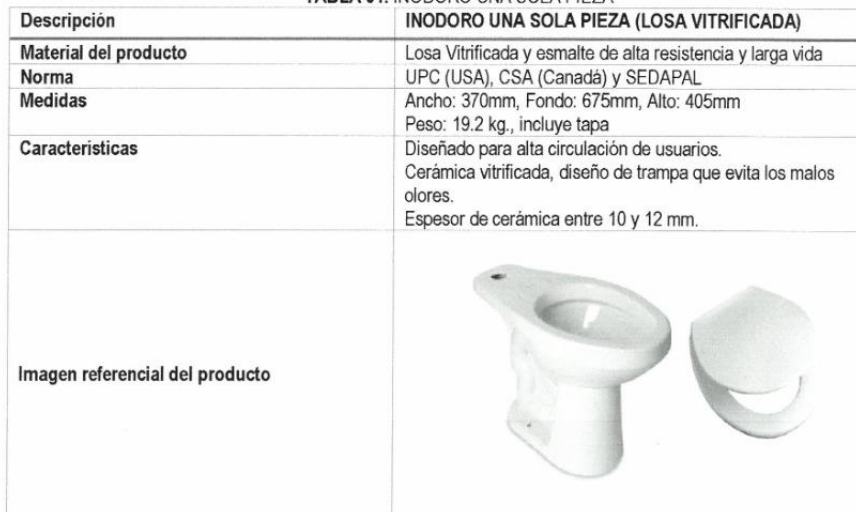
TABLA 01. INODORO UNA SOLA PIEZA