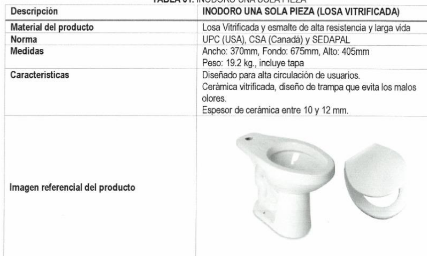
TABLA 01. INODORO UNA SOLA PIEZA

GOBIERNO REGIONAL AYACUCHO Proyecto: "Mejoramiento de los Servicios Educativos en la Institución Educativa Pública María Auxiliadora, Distrito Huanta, Provincia de Huanta - Ayacucho" Ing. Jhon R. Carrasco Sinchitullo CIP: 111800 RESIDENTE DE OBRA