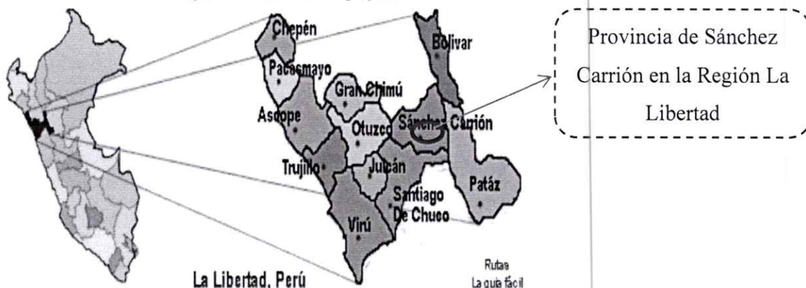
Imagen N° 1. Ubicación del proyecto