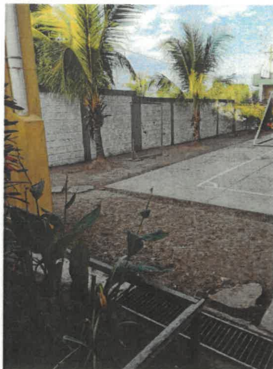
VISTAS DE LA SITUACION ACTUAL DE LA INSTITUCION EDUCATIVA