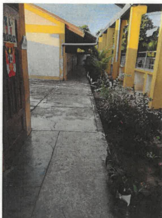
VISTAS DE LA SITUACION ACTUAL DE LA INSTITUCION EDUCATIVA