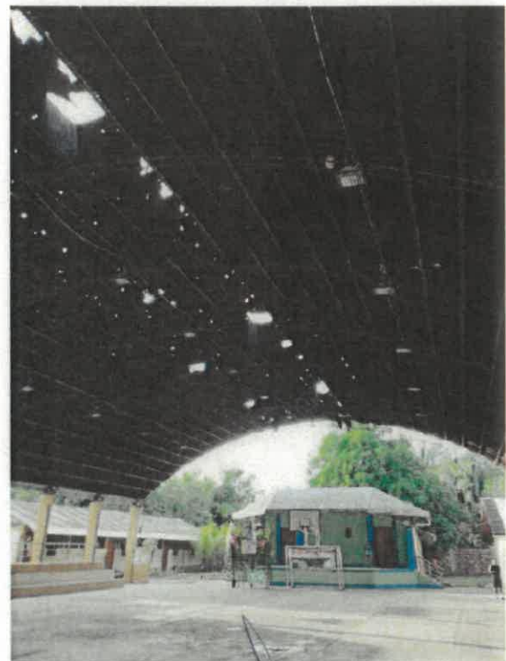
VISTAS DE LA SITUACION ACTUAL DE LA INSTITUCION EDUCATIVA