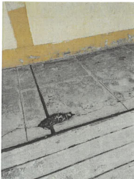
VISTAS DE LA SITUACION ACTUAL DE LA INSTITUCION EDUCATIVA