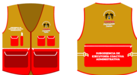
IMAGEN REFERENCIAL: SUBGERENCIA DE EJECUTORIA COACTIVA ADMINISTRATIVA