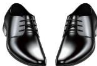
IMAGEN REFERENCIAL: SUGERENCIA DE FISCALIZACION

Palacio Municipal: Plaza de Armas s/n Av. España cdra. La Libertad km. 11 Av. Túpac Amaru Centro Cívico Municipal: Av. 22 de Agosto cdra. 8 Urb. Santa Luzmila www.municomas.gob.pe