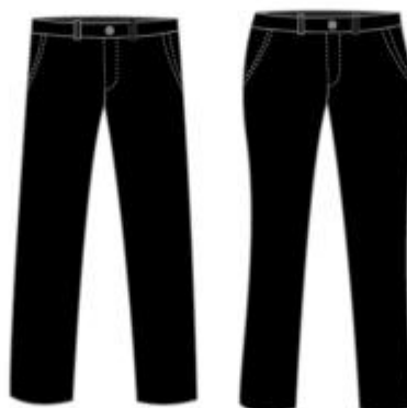
IMAGEN REFERENCIAL: GIR (HOMBRE Y MUJER)

Palacio Municipal: Plaza de Armas s/n Av. España cdra. La Libertad km. 11 Av. Túpac Amaru Centro Cívico Municipal: Av. 22 de Agosto cdra. 8 Urb. Santa Luzmila www.municomas.gob.pe