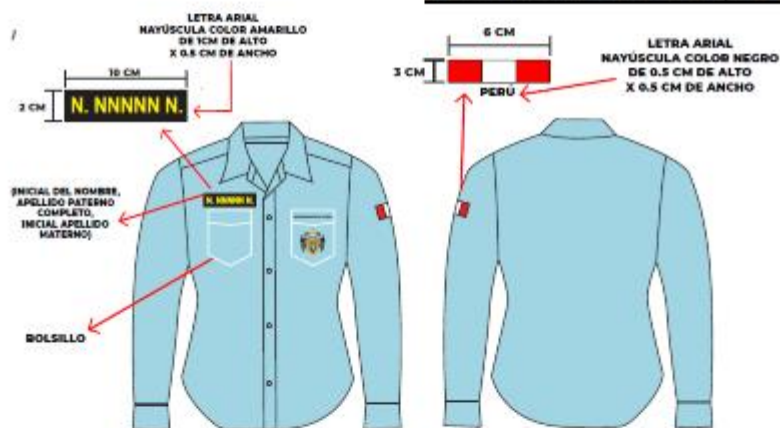
IMAGEN REFERENCIAL: SERENAZGO (MUJER)