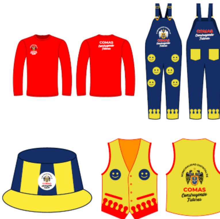
IMAGEN REFERENCIAL: SEGURIDAD VIAL

Palacio Municipal: Plaza de Armas s/n Av. España cdra. La Libertad km. 11 Av. Túpac Amaru Centro Cívico Municipal: Av. 22 de Agosto cdra. 8 Urb. Santa Luzmila www.municomas.gob.pe