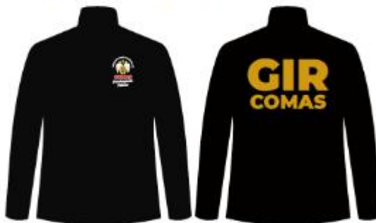
IMAGEN REFERENCIAL - GIR