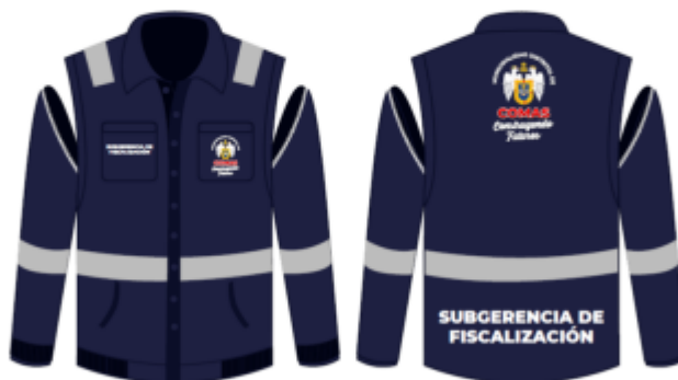
IMAGEN REFERENCIAL: SUB GERENCIA DE FISCALIZACION

Palacio Municipal: Plaza de Armas s/n Av. España cdra. La Libertad km. 11 Av. Túpac Amaru Centro Cívico Municipal: Av. 22 de Agosto cdra. 8 Urb. Santa Luzmila www.municomas.gob.pe