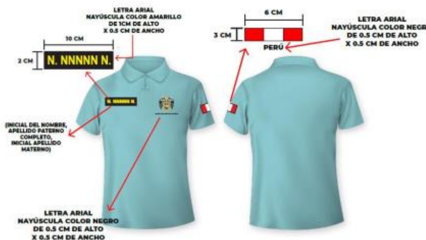
IMAGEN REFERENCIAL: SERENAZGO

Palacio Municipal: Plaza de Armas s/n Av. España cdra. La Libertad km. 11 Av. Túpac Amaru Centro Cívico Municipal: Av. 22 de Agosto cdra. 8 Urb. Santa Luzmila www.municomas.gob.pe