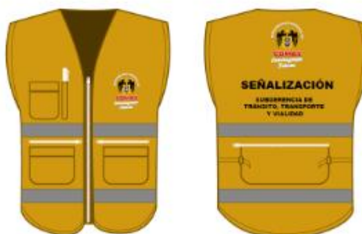
IMAGEN REFERENCIAL: SEÑALIZACION

Palacio Municipal: Plaza de Armas s/n Av. España cdra. La Libertad km. 11 Av. Túpac Amaru Centro Cívico Municipal: Av. 22 de Agosto cdra. 8 Urb. Santa Luzmila www.municomas.gob.pe