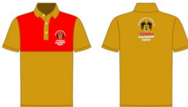
IMAGEN REFERENCIAL: INSPECTOR DE CAMPO