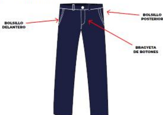
IMAGEN REFERENCIAL: SERENAZGO E INSPECTOR MUNICIPAL