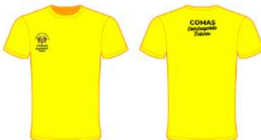
IMAGEN REFERENCIAL: SEGURIDAD VIAL (COLOR AMARILLO)