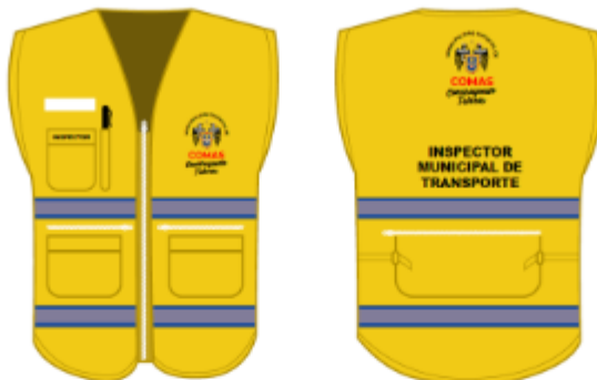
IMAGEN REFERENCIAL: INSPECTOR MUNICIPAL DE TRANSPORTE