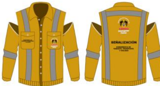
IMAGEN REFERENCIAL: SEÑALIZACIÓN