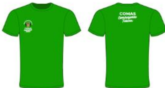
IMAGEN REFERENCIAL: SEGURIDAD VIAL (COLOR VERDE)