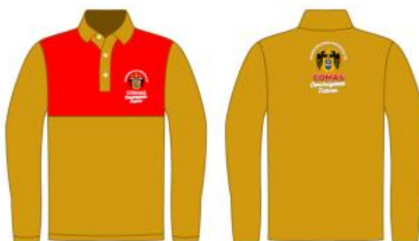
IMAGEN REFERENCIAL: INSPECTOR DE CAMPO