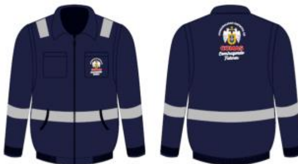
IMAGEN REFERENCIAL: SURGERENCIA DE FISCALIZACION

Palacio Municipal: Plaza de Armas s/n Av. España cdra. La Libertad km. 11 Av. Túpac Amaru Centro Cívico Municipal: Av. 22 de Agosto cdra. 8 Urb. Santa Luzmila www.municomas.gob.pe