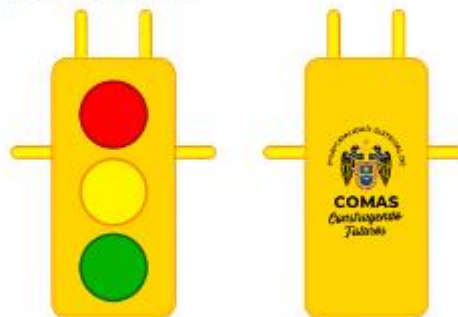
IMAGEN REFERENCIAL: SEGURIDAD VIAL

Palacio Municipal: Plaza de Armas s/n Av. España cdra. La Libertad km. 11 Av. Túpac Amaru Centro Cívico Municipal: Av. 22 de Agosto cdra. 8 Urb. Santa Luzmila www.municomas.gob.pe