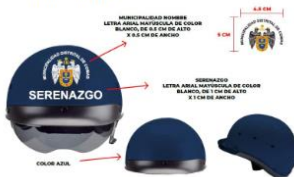
IMAGEN REFERENCIAL: SERENAZGO