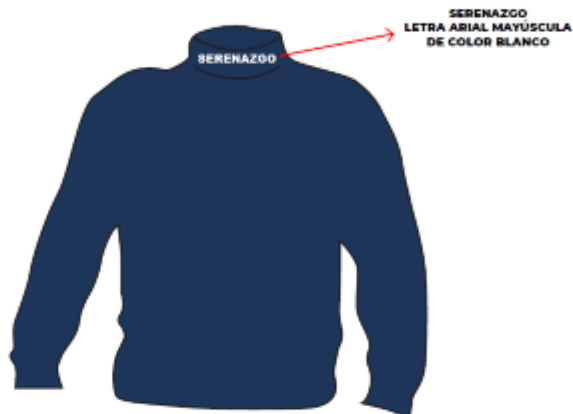
IMAGEN REFERENCIAL: SERENAZGO