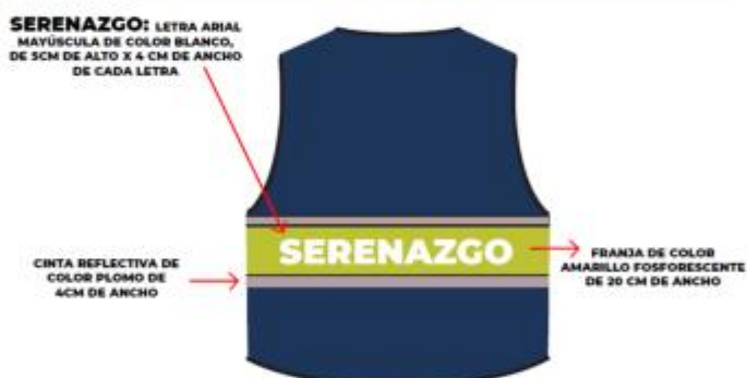
IMAGEN REFERENCIAL: SERENAZGO