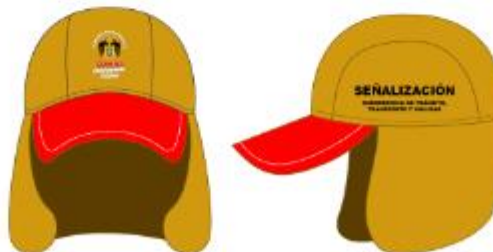
IMAGEN REFERENCIAL: SEÑALIZACIÓN

Palacio Municipal: Plaza de Armas s/n Av. España cdra. La Libertad km. 11 Av. Túpac Amaru Centro Cívico Municipal: Av. 22 de Agosto cdra. 8 Urb. Santa Luzmila www.municomas.gob.pe