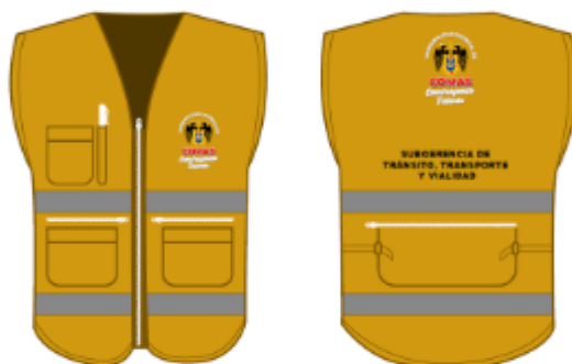
IMAGEN REFERENCIAL: INSPECTOR DE CAMPO