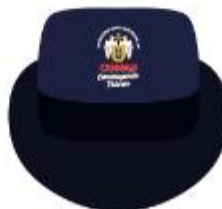
IMAGEN REFERENCIAL: SUBGERENCIA DE FISCALIZACION

Palacio Municipal: Plaza de Armas s/n Av. España cdra. La Libertad km. 11 Av. Túpac Amaru Centro Cívico Municipal: Av. 22 de Agosto cdra. 8 Urb. Santa Luzmila www.municomas.gob.pe