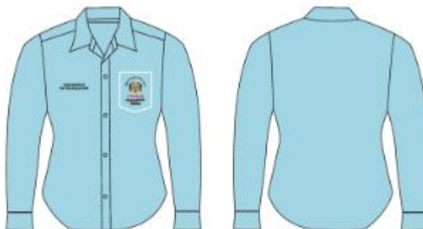
IMAGEN REFERENCIAL: FISCALIZACION (MUJER)