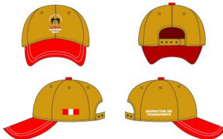
IMAGEN REFERENCIAL: INSPECTORES DE TRANSPORTE