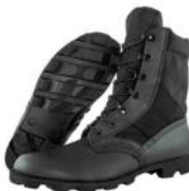
IMAGEN REFERENCIAL: SERENAZGO