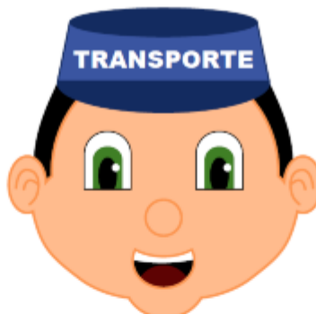
IMAGEN REFERENCIAL: SEGURIDAD VIAL