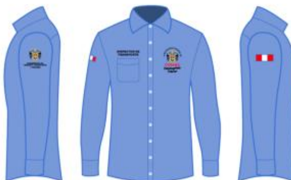
IMAGEN REFERENCIAL: INSPECTOR MUNICIPAL DE TRANSPORTE