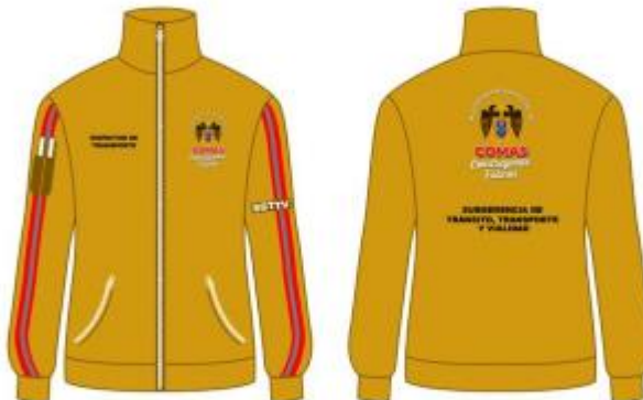
IMAGEN REFERENCIAL: SURGERENCIA DE TRANSITO, TRANSPORTE Y VIALIDAD