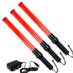
IMAGEN REFERENCIAL: SERENAZGO

Palacio Municipal: Plaza de Armas s/n Av. España cdra. La Libertad km. 11 Av. Túpac Amaru Centro Cívico Municipal: Av. 22 de Agosto cdra. 8 Urb. Santa Luzmila www.municomas.gob.pe