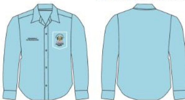
IMAGEN REFERENCIAL: FISCALIZACION (HOMBRE)

Palacio Municipal: Plaza de Armas s/n Av. España cdra. La Libertad km. 11 Av. Túpac Amaru Centro Cívico Municipal: Av. 22 de Agosto cdra. 8 Urb. Santa Luzmila www.municomas.gob.pe