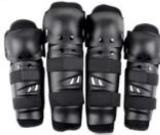
IMAGEN REFERENCIAL: SERENAZGO