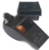
IMAGEN REFERENCIAL: SERENAZGO