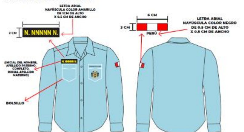
IMAGEN REFERENCIAL: SERENAZGO (HOMBRE)