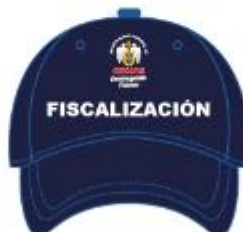
IMAGEN REFERENCIAL: SUB GERENCIA DE FISCALIZACION

Palacio Municipal: Plaza de Armas s/n Av. España cdra. La Libertad km. 11 Av. Túpac Amaru Centro Cívico Municipal: Av. 22 de Agosto cdra. 8 Urb. Santa Luzmila www.municomas.gob.pe