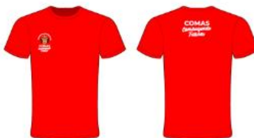
IMAGEN REFERENCIAL: SEGURIDAD VIAL (COLOR ROJO)

Palacio Municipal: Plaza de Armas s/n Av. España cdra. La Libertad km. 11 Av. Túpac Amaru Centro Cívico Municipal: Av. 22 de Agosto cdra. 8 Urb. Santa Luzmila www.municomas.gob.pe