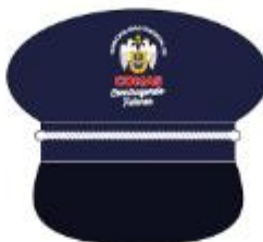
IMAGEN REFERENCIAL - SUBGERENCIA DE FISCALIZACION