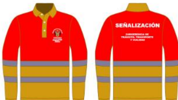
IMAGEN REFERENCIAL: SEÑALIZACIÓN