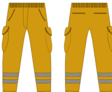
IMAGEN REFERENCIAL: SEÑALIZACIÓN