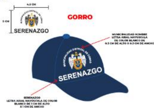
IMAGEN REFERENCIAL: SUB GERENCIA DE SERENAZGO