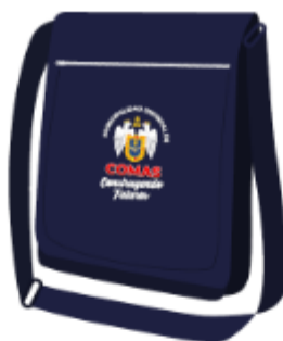
IMAGEN REFERENCIAL: SUB GERENCIA DE FISCALIZACION