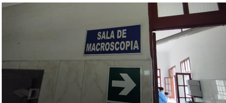
IMAGEN N° 01

A continuación, se presenta una muestra fotográfica del estado situacional de la infraestructura del Establecimiento de Salud.