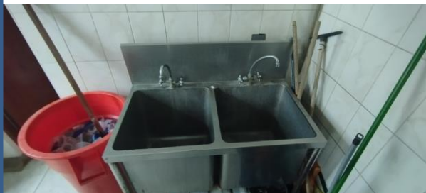
IMAGEN N° 04