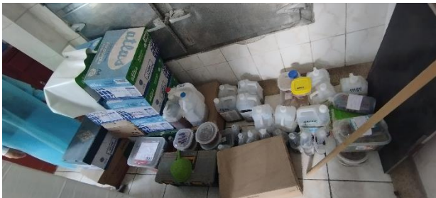
IMAGEN N° 02