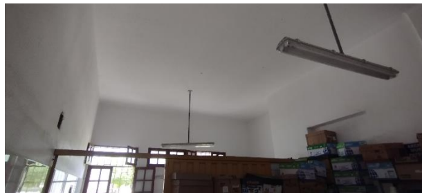
IMAGEN N° 05