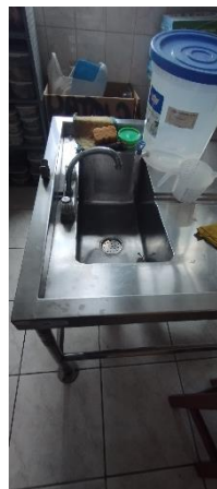
IMAGEN N° 03

Piso deteriorado fragua presenta hgongod