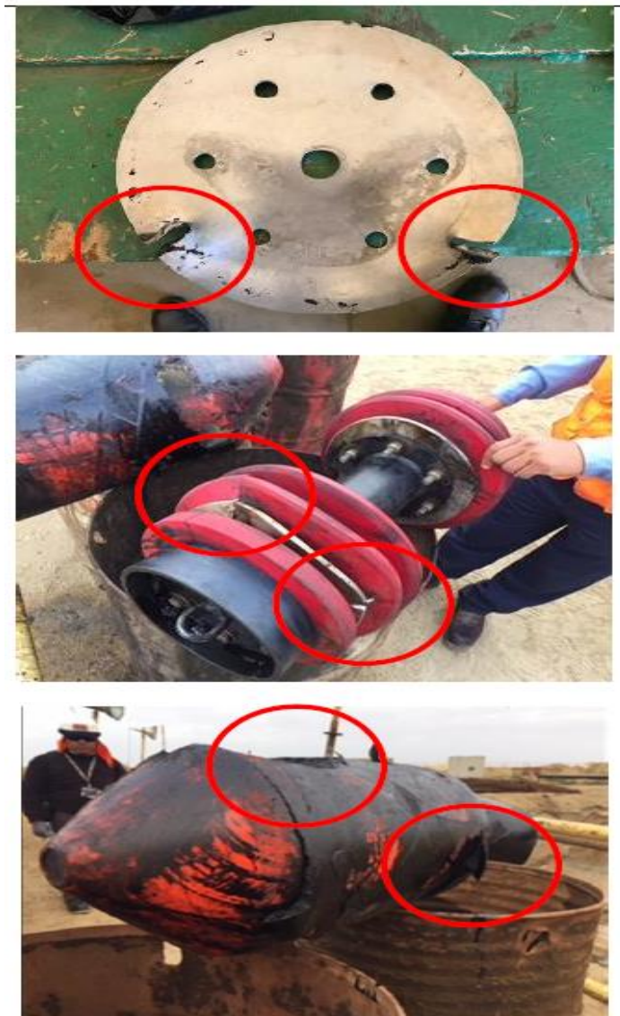
Figura 2. Cartelas al interior de las líneas submarinas, probablemente adyacentes a la brida final de la línea.

El pago de este ítem constituirá compensación completa por los trabajos descritos incluyendo mano de obra, leyes sociales, materiales, equipo, imprevistos y en general todo lo necesario para completar la partida. El pago se realizará de acuerdo con la aprobación de la Supervisión o Administrador del servicio.