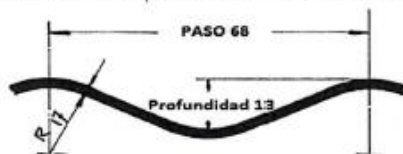
Figura 1. Dimensiones de la corruga 68 mm x 13 mm

Las corrugas de las planchas debe formar curvas suaves continuas. La corruga esta designada por el paso (distancia de cresta a cresta) y la profundidad de la corruga. Tal como se muestra en la Figura 1. El tamaño nominal de la corruga es 68 mm x 13 mm para las alcantarillas TMC Mini Múltiple SP MP-68. En Tabla 4 se muestran los requerimientos dimensionales referentes a la corruga.