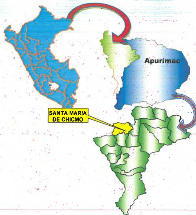
Mapa N°02: Ubicación de la Región de Apurímac

UBICACIÓN POLÍTICA A NIVEL DEL DEPARTAMENTO DE APURÍMAC