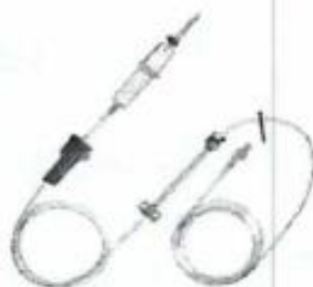
Fig. 1.: Línea para Bomba de Infusión sin Volutrol (No implica diseño)