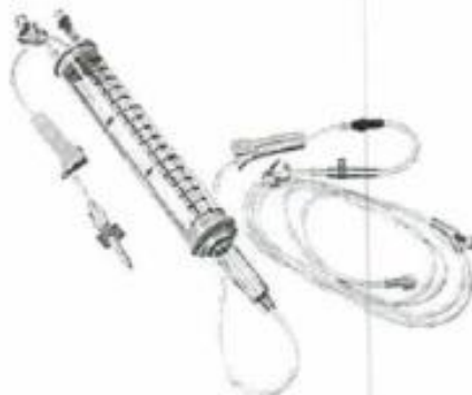
Fig. 1.: Línea para Bomba de Infusión con Volutrol (No implica diseño)