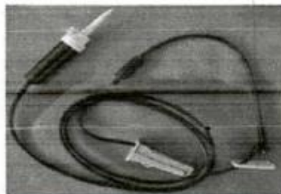
Fig. 1. Línea para Bomba de Infusión Opaca (No implica diseño)