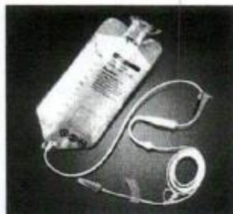
Fig 1.: Bolsa para nutrición enteral (no incluye diseño)