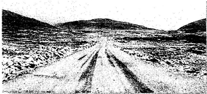
Foto N° 02: Deterioro por erosión y desprendimiento de la capa superior de la Vía