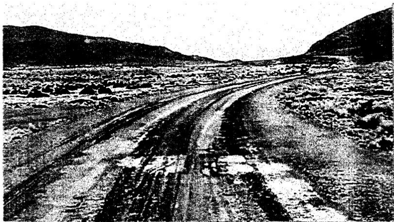
Foto N° 06: Quebrada del Rio Cazador en la progresiva 20+660, presenta Badén de concreto colapsado, removido de su posición por el ingreso de avenidas en periodos de lluvias.