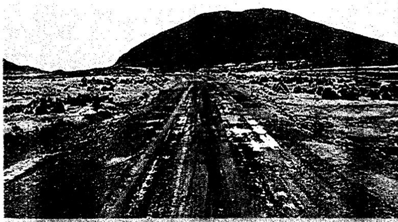
Foto N° 05 Presencia de lodazales, provocando deformaciones en la vía