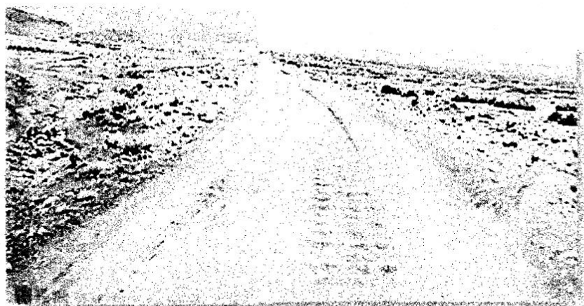
Foto N° 04 Presencia de zonas con fallas por Encalaminado de la vía