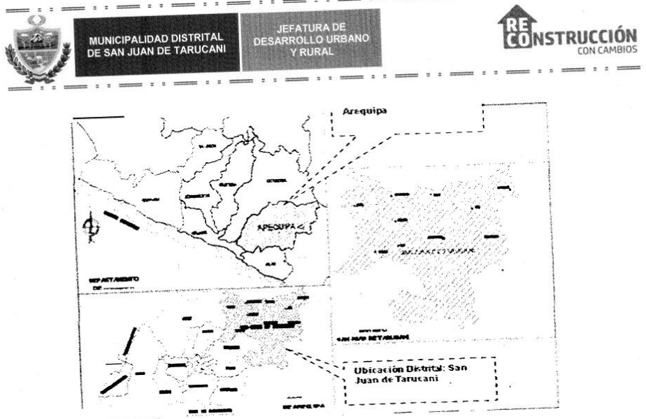
Imagen 02.01.- Ubicación del Proyecto, en el distrito de San Juan de Tarucani, provincia y departamento Arequipa CUADRO 2-2