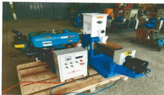
Ilustración 1 IMAGEN REFERENCIAL