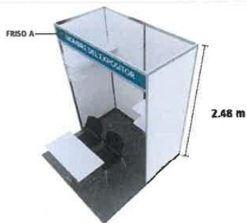
VISTA 1 FRENTE